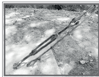
TENSAR CABLES DE ACERO